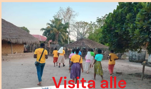
Visita alle famiglie

Un GRAZIE particolare all'Associazione Agape Onlus di Preganziol per il sostegno economico!